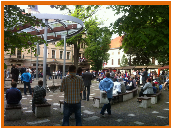
Oficiálne zahájenie LeaderFEST 2012 na Námestí Majstra Pavla

Dňa 30.mája 2012 sme sa zúčastnili na LeaderFest 2012, ktorý sa konal v Levoči. MAS Partnerstvo BACHUREŇ sa prezentovalo vystúpením súboru Hermanovčan , ktorý svojím spevom, tancom a temperamentom očaril všetkých okolo idúcich.